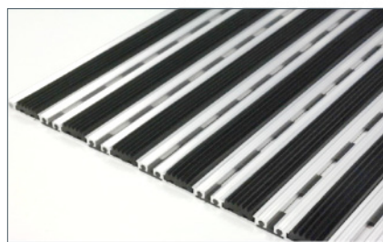
FELPUDOS DE ALUMINIO CON CAUCHO