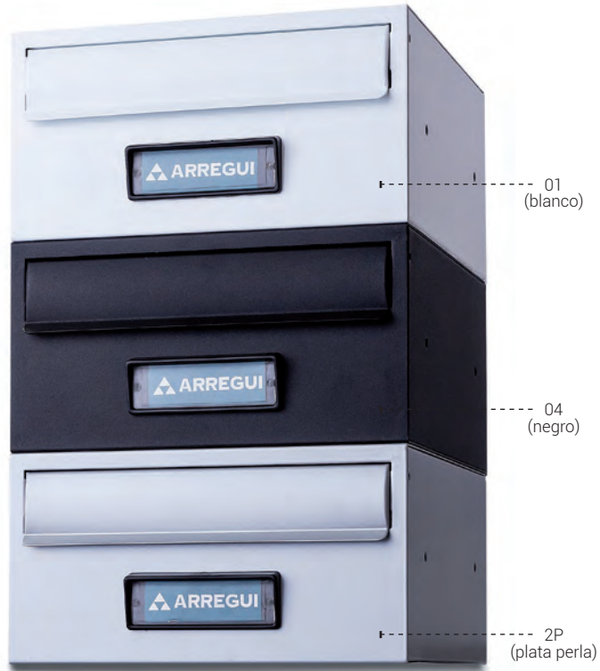
H4750 - Capacidad para documentos A5.